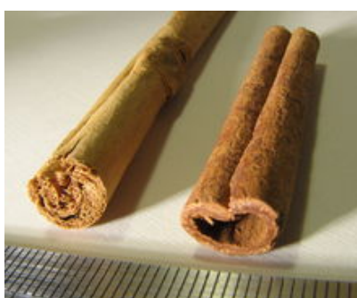
Til venstre ses Ceylon kanel, til højre Cassia kanel.

En god kvalitetstest er også når kanel bliver behandlet med jod, er der ingen effekt, så længe kanelen er af god kvalitet. Når man derimod behandler Cassia giver det en mørk blå farve.